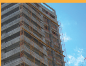
ECHAF. DE FAÇADE